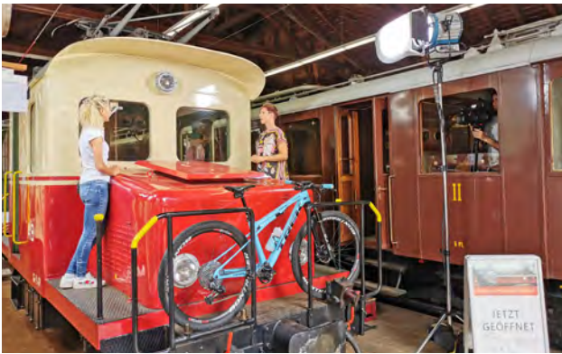
TVO-Sendung «Im Zug mit...»

Das Ende 2019 neu produzierte TVO-Sendeformat «Im Zug mit ...» sorgte im Berichtsjahr für hohe Werbepräsenz in TV, Radio und Printmedien. In 38 Sendungen interviewten die TVO-Moderatorinnen zahlreiche prominente Persönlichkeiten; zuerst im Tango während einer Fahrt zwischen Appenzell-St.Gallen-Trogen und später aufgrund der Maskenpflicht im Depot Wasserauen. TVO strahlte die 20-minütige Sendung jeden Dienstagabend aus; diese läuft auch im Jahr 2021 mit den AB als Partner weiter.