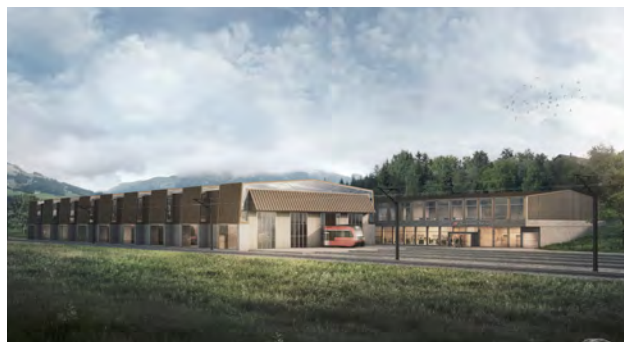
Visualisierung Servicezentrum Appenzeller Bahnen

Mit dem Bau des Servicezentrums Appenzeller Bahnen in Appenzell wird ein wichtiger Schritt für die Zusammenlegung der Werkstatt-Standorte für den effizienten Fahrzeugunterhalt geschaffen. Mit dem Neubau wird den Anforderungen an die Instandhaltung der 16 neuen Niederflurfahrzeuge Tango und Walzer Rechnung getragen. Der Planungsstand ist fortgeschritten. Im August 2020 durften zahlreiche interessierte Personen an der Informationsveranstaltung in der Aula Gringel in Appenzell begrüsst werden. Per Ende Jahr wurde die Planungsgrundlage finalisiert. Die öffentliche Projektauflage erfolgt im Februar 2021. Der Baubeginn des 55 Millionen Franken Projekts ist Mitte 2022 und die Inbetriebnahme im Jahr 2024 geplant.