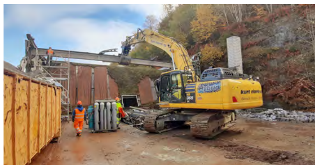
Abbruch Depotteil Werkstatt Herisau