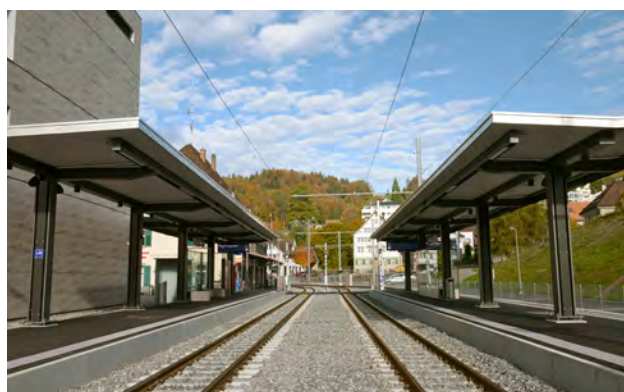
Neuer Bahnhof Teufen