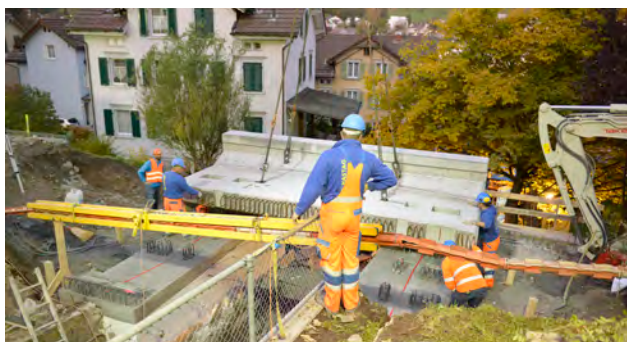
Einbau Brückenplatte «alte Steig», Herisau

Der Bahnhofumbau Waldstatt bedingte eine Totalsperre zwischen Herisau und Jakobsbad. Gleichzeitig wurden ein Teil der Werkstatt Herisau abgebrochen als Vorarbeiten für den Bahnhofumbau, die Überführung «Böhl» und die Unterführung «alte Steig» ersetzt und eine grosse Fahrbahnerneuerung inkl. Fahrleitungsersatz zwischen Herisau und Wilen realisiert. Ferner haben die Teams der AB zahlreiche Schienen ausgewechselt und Dutzende von Anlagen gewartet, damit die Substanz erhalten wird und die Sicherheit jederzeit gewährt ist.