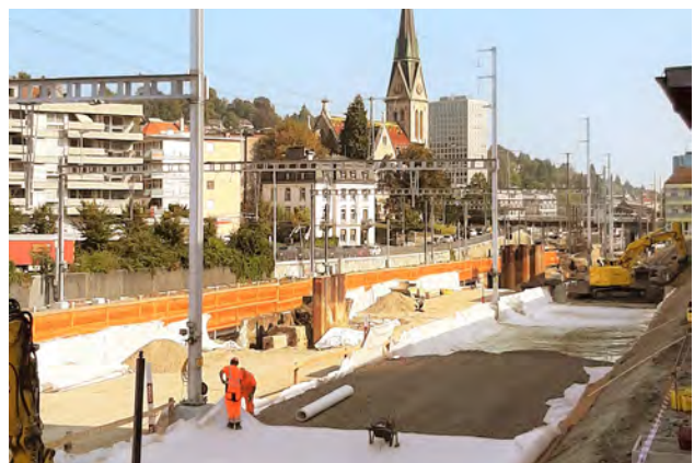
Umbau Güterbahnhof St.Gallen