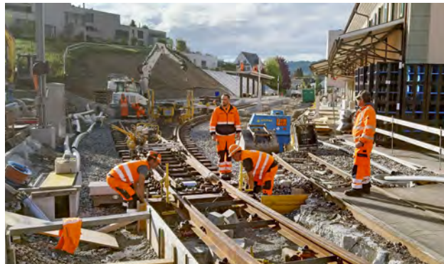
Umbauarbeiten Bahnhof Teufen

Die Variante Doppelspur stösst bei einem Teil der Teufner Bevölkerung auf Widerstand. Unter der Führung des Bundesamtes für Verkehr (BAV) sollen nun wie national üblich im Rahmen einer sogenannten Korridorstudie das Angebotskonzept und die dazu erforderlichen Infrastrukturen auf der Strecke Trogen-St.Gallen-Appenzell aufgezeigt werden. Grundlage für die Korridorstudie bildet das vom eidgenössischen Parlament genehmigte nationale Angebotskonzept 2035. Die Ergebnisse sind im Juni 2021 zu erwarten und gelten als verbindlich. Die AB nutzen die Zeit bis zum Vorliegen der Ergebnisse aus der Korridorstudie, um Fakten zur Machbarkeit eines Doppelspurtunnels zu gewinnen. Sollten die Ergebnisse aus der Korridorstudie nicht im Widerspruch zu den bisherigen Planungsgrundlagen stehen, werden die AB das avisierte Projekt weiter vorantreiben mit dem Ziel, das Plangenehmigungsdossier (PGV) bis Ende 2021 einzureichen. Die AB sind zuversichtlich, mit dem gewählten Vorgehen und einer soliden Grundlage in eine zukunftsfähige und sinnvolle Lösung zu investieren.