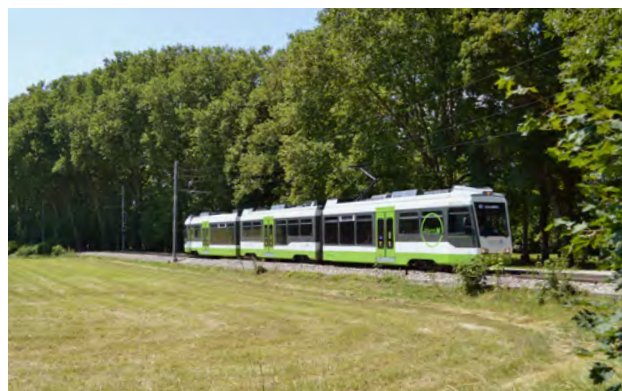
Umbau GTW transN

Anfang März 2020 lieferten die AB den letzten von fünf Gelenktriebwagen (GTW), welche auf der Strecke St.Gallen-Trogen unterwegs waren, nach Umbau und Revision an die Transports Publics Neuchâtelois (TransN) aus. Die ehemaligen TB-Fahrzeuge verkehren entlang dem Neuenburgersee von Neuchâtel nach Boudry.