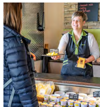
Kostprobe bei der Urnäser Milchspezialitäten AG

Mit der Fensterplatz-App, einem digitalen Reiseführer für das Liniennetz, nehmen die AB eine Pionierrolle ein. Die App wurde in den vergangenen Monaten intensiv weiterentwickelt und im August des Berichtsjahres neu lanciert. Nebst den bestehenden Themen Freizeit & Brauchtum und Politik & Eisenbahn ist nun zusätzlich das Thema Kulinarik auf der kostenlosen App verfügbar. Das neue Thema enthält eine interaktive Komponente: Gutscheine von Partnerbetrieben entlang der Linie animieren die Fahrgäste kurz auszusteigen, beim Partner leckere Spezialitäten zu probieren und später wieder weiterzufahren. In den ersten vier Monaten zählte die App über 2000 Downloads.